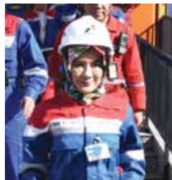
NICKE WIDYAWATI Plt. Direktur Utama Pertamina

Berbagai apresiasi diberikan kepada kita, baik dari masyarakat lewat sosial media maupun pemerintah. Berkat sarana BBM dan fasilitas yang kita berikan, mudik berjalan lancar. Semua ini tentu tak lepas dari kerja keras seluruh jajaran Pertamina. Terima kasih pada seluruh jajaran, meskipun ada cuti bersama, tetapi tetap bekerja keras melayani masyarakat. Terima kasih semuanya.