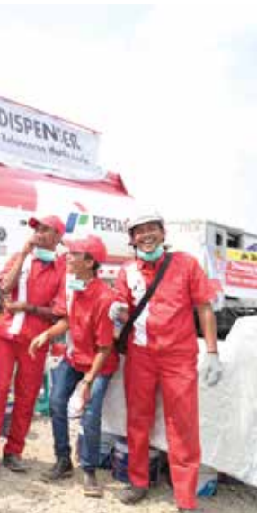
Tim Satgas RAFI 2018 yang bertugas di rest area Cipali KM 130 pada arus mudik dan balik tersenyum ceria karena dapat melayani para pemudik sehingga membuat perjalanan mudik merasa aman dan nyaman.

Menteri Energi dan Sumber Daya Mineral (ESDM) Ignasius Jonan menaiki motor satgas saat meninjau kesiapan Satgas Pertamina dalam pengamanan stok BBM di jalur mudik darat mulai dari Jakarta hingga Semarang pada Sabtu, (2/6/2018). Tinjauan tersebut akan dilanjutkan dari Semarang hingga Surabaya keesokan harinya (3/6/2018).