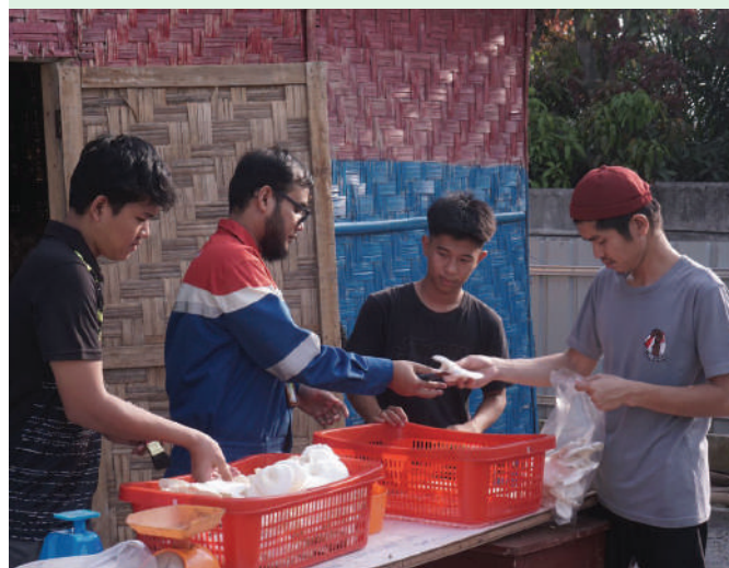
Salah satu Perwira Pertagas tetap memberikan pendampingan kepada Kelompok Tani Baiturrahman ketika panen jamur tiram di Kelurahan Harjosari II Kecamatan Medan Amplas, Kota Medan, Sumatera Utara, (17/4/2023).

Seperti diketahui, Jamur menjadi komoditas hortikultura yang biasa dikonsumsi masyarakat. Selain kaya akan nutrisi, jamur tiram rendah kalori dan tinggi serat. Badan Pusat Statistik (BPS) mencatat Produksi jamur 2021 mencapai 90,42 ton, dan angka ini terus meningkat hingga 2022. Jumlah tersebut menunjukkan bahwa peminat jamur tiram di Indonesia cukup tinggi. ●SHG-PERTAGAS