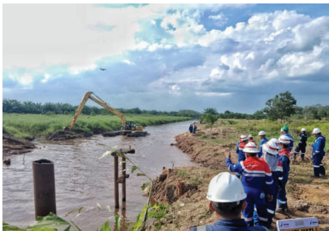
Proses pembersihan sungai sepanjang 28 km yang dilakukan PHR untuk mengantisipasi banjir.

Rudi menegaskan, secara berkala PHR terus melakukan perawatan aliran sungai dari penumpukan sampah yang mengganggu jalannya air menuju hilir. "Mari kita jaga lingkungan bersama, terutama masalah sampah yang menjadi salah satu penyebab banjir di wilayah ini," imbaunya kepada masyarakat. ●SHU-PHR