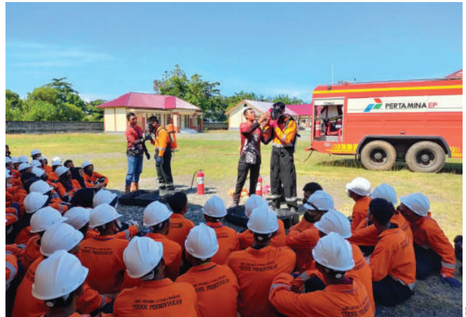
Siswa SMKN 2 Toili Barat mengikuti Donggi Matindok Field Goes To School sekaligus ujian kompetensi dan keahlian yang diadakan oleh Pertamina EP Donggi Matindok Field.