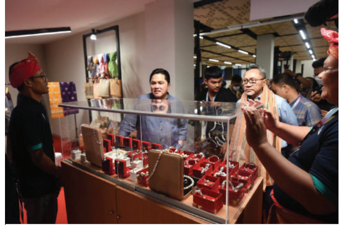
Menteri BUMN Erick Thohir bersama dengan Menteri Perdagangan Zulkifli Hasan melihat produk mitra binaan Pertamina saat acara SME'S HUB Rumah BUMN yang merupakan bagian dari KTT ASEAN Ke-42 di Water Front, Labuan Bajo, Manggarai Barat, Nusa Tenggara Timur Pada Selasa (9/5/2023).

VP Corporate Communication Pertamina, Fadjar Djoko Santoso berharap momentum berharga yang diberikan kepada para UMKM dapat dimanfaatkan dengan baik, mengingat kegiatan ini banyak dihadiri oleh tamu dari berbagai negara yang tentu saja akan memberikan peluang bagi mitra binaan untuk