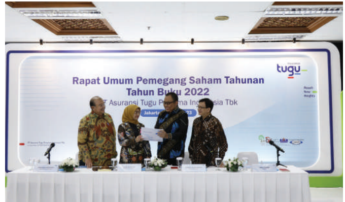
Direksi Tugu Insurance berbincang usai mengikuti RUPST dan memberikan keterangan pers.

Untuk total aset secara konsolidasian, tercatat Rp21,58 triliun atau naik dibandingkan periode yang sama tahun lalu sebesar Rp20,19 triliun, sedangkan secara induk total aset tercatat Rp13,51 triliun naik dari Rp13,09 triliun. Adapun ekuitas konsolidasian turut meningkat dari Rp8,79 triliun menjadi Rp9,17 triliun, sedangkan ekuitas induk mencapai Rp5,65 triliun