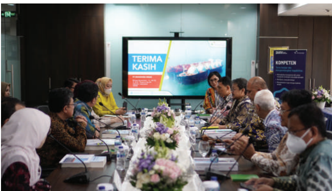
Direksi Nusantara Regas memaparkan pencapaian kinerja tahun buku 2022 dalam Rapat Umum Pemegang Saham Tahunan.

Dalam kinerja operasinya, Nusantara Regas berhasil menyalurkan 88,69 juta Million British Thermal Unit (MMBTU) gas kepada pelanggannya yakni pembangkit listrik guna menopang kebutuhan listrik di wilayah DKI Jakarta dan Jawa bagian barat. Selama tahun 2022, NR juga berhasil mengelola kehandalan fasilitas sampai 100% sehingga tidak terjadi unplanned shut down .