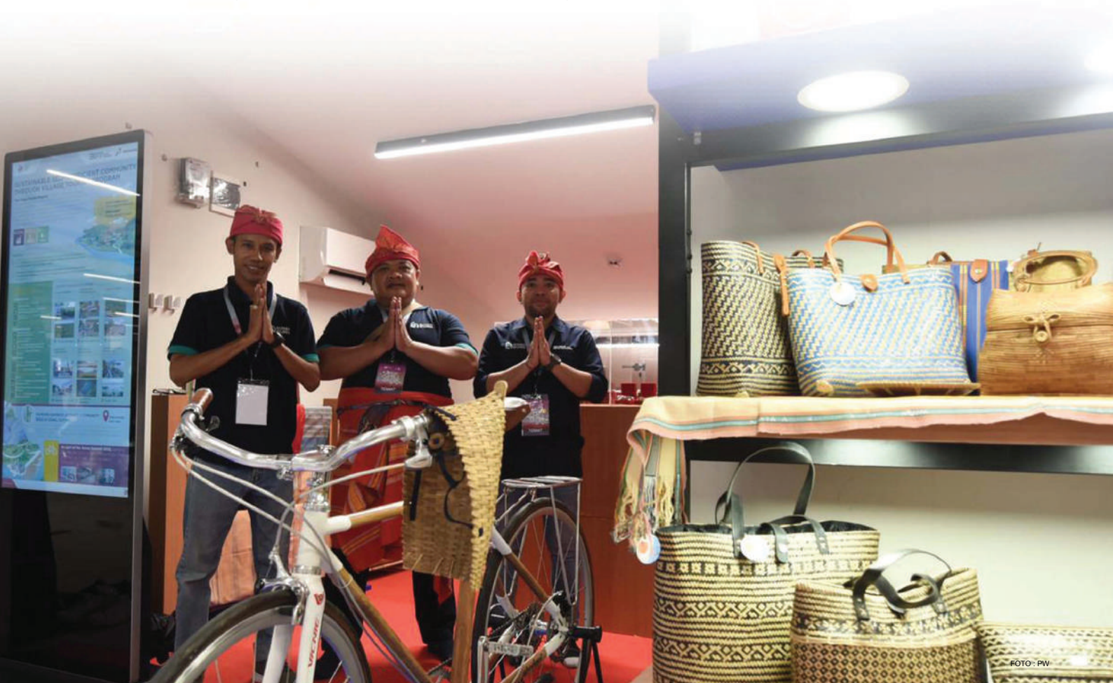
Pameran Rumpun menampilkan produk bambu inovatif, seperti sepeda bambu Spedagi, dan maket kabin bambu ekowisata serta rumah tradisional. Pameran ini digelar selama dari 7 -13 Mei 2023 di Goa Batu Cermin Exhibition Hall.

“Kita hadir di momen KTT ASEAN 2023 selain untuk memeriahkan acara KTT nya sendiri tetapi juga bagian satu upaya kita mendukung pembangunan berkelanjutan melalui ekonomi hijau, energi hijau dan mobilitas hijau,” tandas Fadjar. •PTM