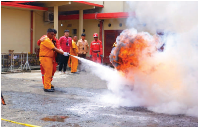
Salah satu pemuda yang tinggal di sekitar Kilang Plaju diajarkan menggunakan APAR untuk memadamkan api.