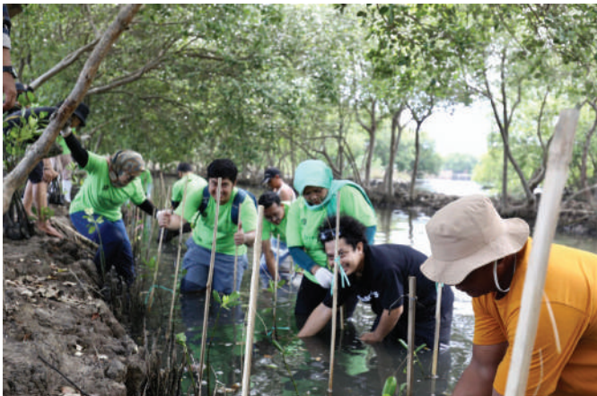
Elnusa Green Action, salah satu upaya untuk mewujudkan lingkungan yang hijau dan lestari.