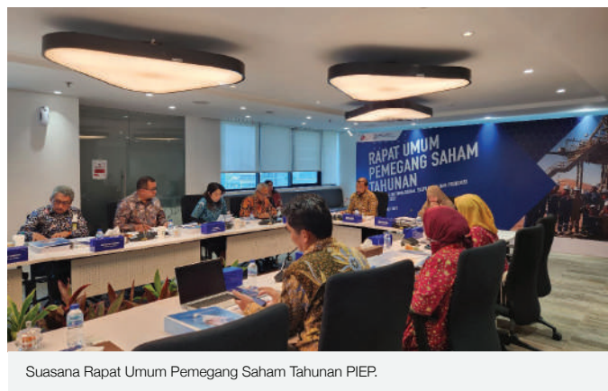
Suasana Rapat Umum Pemegang Saham Tahunan PIEP.

Sepanjang 2022, terkait komitmen terhadap HSSE, perusahaan telah mendapatkan hasil yang sangat baik dan merupakan yang terbaik di Subholding Upstream Pertamina. Seperti disampaikan beberapa waktu lalu, pencapaian ini pun lebih baik dari tahun 2021 dengan zero injury dan hal ini mempertahankan pencapaian kinerja HSSE tanpa Lost Time Incident (LTI) sejak lapangan dioperasikan oleh Pertamina ( last LTI COPAL, di 6 April 2012) dengan jam kerja aman secara kumulatif adalah 31.396.347. "Keselamatan selalu menjadi prioritas kami dalam melaksanakan kegiatan hulu migas di aset internasional, hal ini mencerminkan kinerja ekseen Perwira/Pertiwi PIEP dan komitmen manajemen yang tinggi untuk terus menjaga safety di setiap aktifitas kegiatan operasi," paparnya. ●SHU-PHI