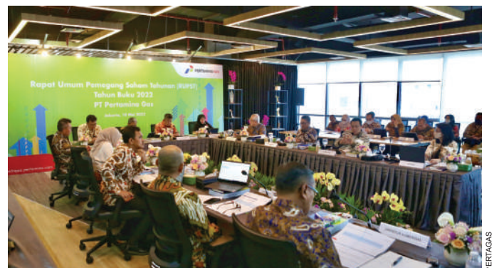
Rapat Umum Pemegang Saham (RUPS) Tahunan PT Pertamina Gas Tahun Buku 2022, pada Rabu, 10 Mei 2023, di Grha Pertamina.

"Program CSR yang diimplementasikan Pertagas pada tahun 2022 diterima oleh lebih dari 55.406 penerima manfaat. Berbagai program tersebut berkontribusi terhadap pengurangan emisi hingga 21,4 ton Estimasi Emisi Karbondioksida Equivalent (CO 2 eq), 64% offsetting land use serta menghasilkan 27 inovasi di bidang CSR," pungkas Gamal. •SHG-PERTAGAS