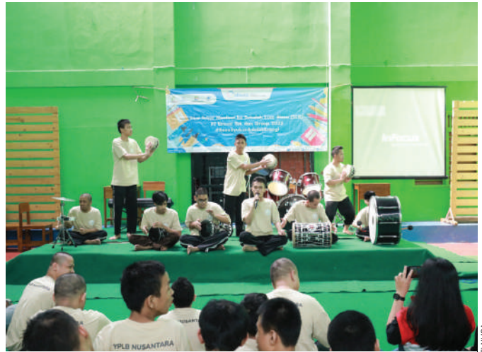
Siswa YPLB menunjukkan kebolehannya dalam memainkan alat musik di hadapan teman-temannya dan relawan Elnusa.