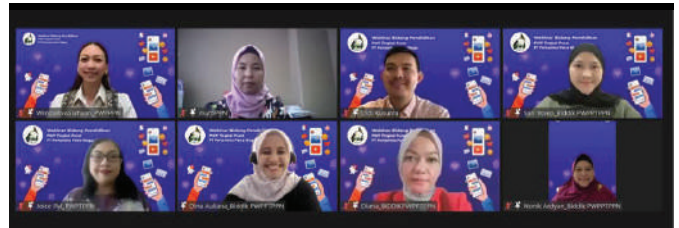
Kegiatan webinar edukatif bertajuk “Cerdas Bijak Bermedia Sosial, Jaga Etika & Privasi” yang diselenggarakan oleh PWP Tingkat Pusat PT Pertamina Patra Niaga.

“Media sosial punya kekuatan yang di era digital ini berdampak pada semua lini kehidupan. Mulai dari menghubungkan kita dengan teman hingga dapat menjangkau audience masyarakat luas. Sebagai pengguna yang bijak, kita harus