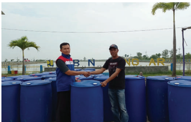
Secara simbolis Kilang Pertamina Balongan menyerahkan 50 drum plastik kepada Desa Sindang, Kecamatan Sindang, Kabupaten Indramayu, yang akan digunakan untuk membuat camp apung pada acara Kemah Apung ( Floating Camp ) se-Jawa Barat yang akan digelar di Embung Jangkar.

"Kami ucapkan terima kasih bantuan yang diberikan Kilang Pertamina Balongan. Semoga bisa mendukung terselenggaranya kegiatan dengan baik," kata Carnita. ●SHR&P BALONGAN