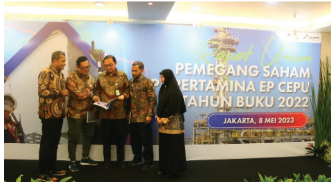
Direksi PEPC berbincang usai RUPS tahun buku 2022.

"Kami bersyukur meskipun harus melalui tantangan yang tidak mudah dengan perekonomian yang masih terdampak di masa pandemi covid dan volatilitas harga minyak dunia, kami berhasil membukukan kinerja positif. Selain