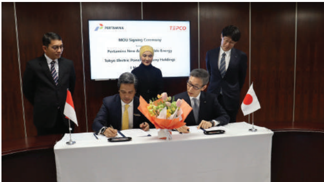
Salah satu kolaborasi Pertamina NRE untuk mengembangkan hidrogen bersih dilakukan bersama Tokyo Electric Power Company Holdings, Incorporated (TEPCO HD).