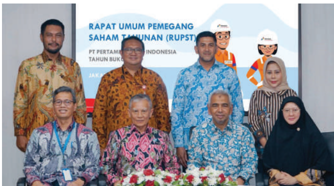
Direksi, Komisaris, dan Pemegang Saham PHI foto bersama usai RUPST.