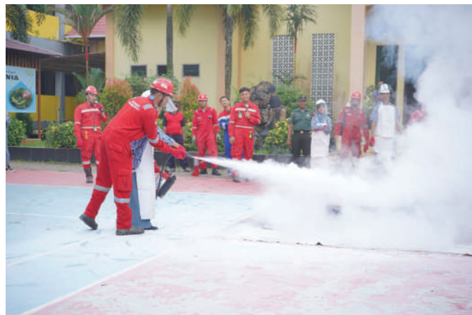
Seorang siswa dibimbing oleh Perwira HSSE Kilang Pertamina Unit Balikpapan dalam penggunaan APAR untuk memadamkan api.

"Berperilaku aman itu harus menjadi kesadaran diri sendiri. Jika melihat orang berperilaku tidak aman misalnya berkendara sepeda motor tanpa helm, jangan diikuti. Karena jika terjadi keadaan yang membahayakan kita, orang yang akan ikut menderita adalah orang terdekat kita, terutama keluarga, bukan orang lain," pesan Chandra. ●SHR&P BALIKPAPAN