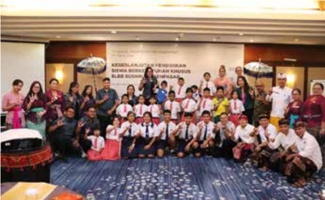
Para siswa SLBB Sushrusa, Denpasar foto bersama usai seremoni penyerahan bantuan dari Patra Jasa.