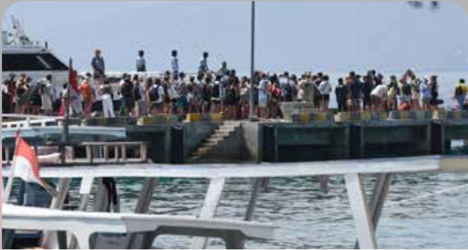
Sejumlah turis bersiap menaiki kapal penyeberangan di Pelabuhan Gili Trawangan, Pemenang, Lombok Utara, pada Jumat, (13/10/2023).