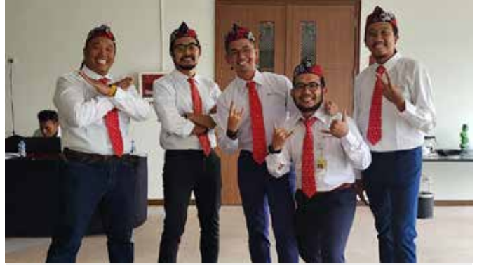
Tim PC Prove Sulphur Paving yang berhasil meningkatkan efisiensi biaya handling sulfur dengan metode eco sulfur paving block di PT Pertamina EP Field Cepu.

JAKARTA - Pada upacara Hari Jadi Pertambangan ke-78, Menteri ESDM Arifin Tasrif memberikan penghargaan Dharma Karya Energi dan Sumber Daya Mineral (ESDM) 2023 kepada sejumlah inovator, pada Senin, 2 Oktober 2023, di halaman kantor Kementerian ESDM, Jakarta. Dalam kesempatan tersebut, Pertamina Group meraih enam penghargaan, yang terdiri dari dua penghargaan Dharma Karya ESDM Madya dan empat penghargaan Dharma Karya ESDM Muda.