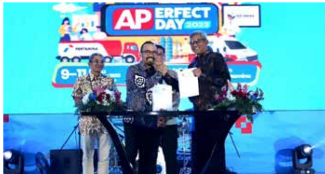
Salah satu Perjanjian Kerja Sama yang ditandatangani di APerfect Day adalah sinergi antara PT Pertamina Patra Niaga dengan PT Patra Jasa untuk perluasan ekosistem digital MyPertamina.

"Buat kami, event ini sangat kami tunggu, karena kami bisa mengenal lebih dalam AP Portofolio satu dengan lainnya sehingga banyak kesempatan bagi kami untuk bisa menggalang sinergi," pungkasnya. ■ RIN