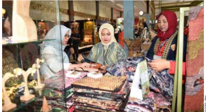
Pengunjung melihat produk mitra binaan Pertamina acara "Inacraft On October 2023" yang diselenggarakan di JCC, Senayan, Jakarta, pada Rabu (4/10/2023).

Selain bermanfaat untuk UMKM, pameran menjadi panggung bagi para kreator dan pengusaha UMKM untuk bersinar di tingkat nasional maupun internasional. "Ajang Inacraft tidak hanya tentang produk dan transaksi semata, tetapi juga tentang membangun komunitas yang solid sehingga dapat mendukung pertumbuhan ekonomi melalui pemberdayaan masyarakat," jelas Fajar.