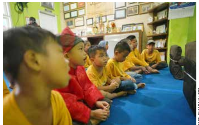
Anak-anak yang dirangkul untuk ikut dalam program Sekolah Anak Percaya Diri (SAPD).

Program tersebut merupakan salah satu Program Tanggung Jawab Sosial Lingkungan (TJSL) perusahaan akan pentingnya menyelesaikan permasalahan sosial Masyarakat dan merupakan komitmen Pertamina dalam mewujudkan Tujuan Pembangunan Berkelanjutan yaitu mendukung poin (4) pendidikan yang berkualitas, (5) kesetaraan gender serta, (11) kota dan pemukiman yang berkelanjutan. ●SHC&T SULAWESI