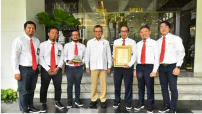
Tim PC Prove Omega foto bersama Menteri ESDM Arifin Tasrif usai menerima penghargaan Dharma Karya ESDM Madya 2023.