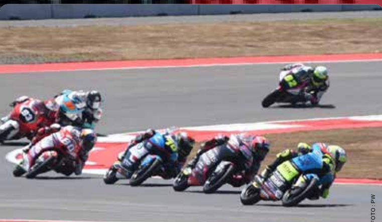
Sejumlah pembalap Moto3 melakukan aksi di tikungan pada ajang Qualifying 2 Pertamina Grand Prix Of Indonesia 2023 di Pertamina Mandalika International Circuit, Lombok Tengah, Nusa Tenggara Barat, Sabtu, 14 Oktober 2023.