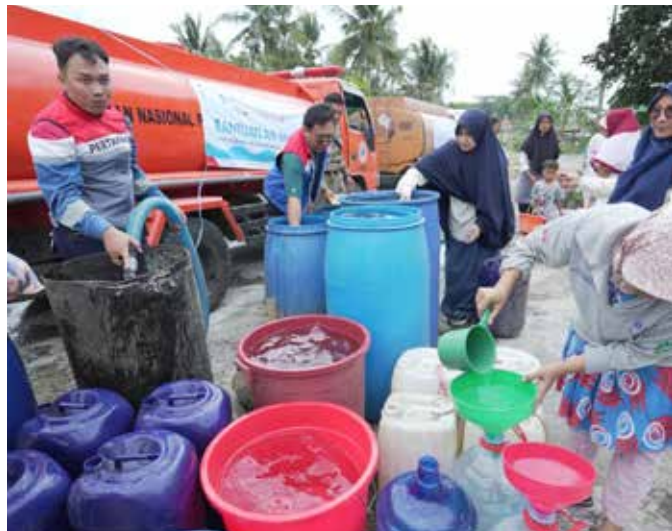
Relawan Respons Bencana PT KPI RU IV Cilacap membantu melakukan pengisian tempat air milik warga yang mengalami kekeringan di Dusun Cigintung, Kelurahan Kutawaru, Kecamatan Cilacap Tengah.