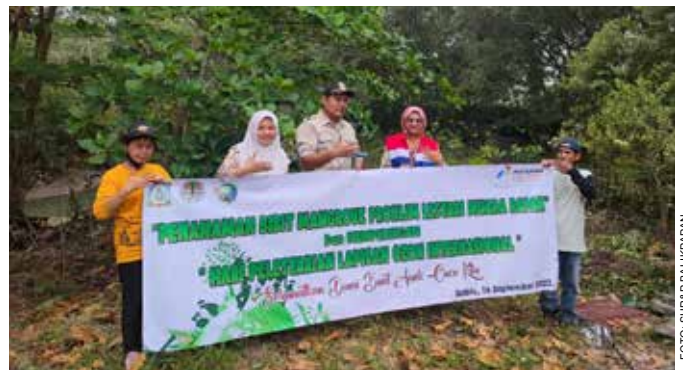
Penanaman mangrove dilakukan di RT 85 Kelurahan Muara Rapak, (16/9/2023).

"Selain sebagai penahan gelombang air laut, hutan mangrove juga menjadi habitat hewan. Bahkan pohon mangrove ini dapat diolah menjadi makanan dan minuman, seperti kopi dan dodol mangrove," tutup Taufik. ●SHR&P BALIKPAPAN