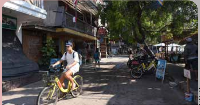
Salah satu turis mancanegara menyewa sepeda di sekitar tempat wisata Gili Trawangan, Lombok.

LOMBOK, NTB - Perhelatan ajang balap kelas dunia MotoGP, Pertamina Grand Prix of Indonesia kembali hadir kedua kalinya di Mandalika pada 13-15 Oktober 2023. Sirkuit Mandalika yang diakui situs resmi MotoGP sebagai sirkuit terindah di ajang MotoGP mampu menyedot perhatian penggemarnya untuk kembali menyaksikan secara langsung ajang balap internasional tersebut.