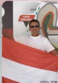
John penonton dari Austria.