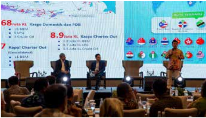
Para pembicara HSSE Forum berbagi pengetahuan kepada peserta.