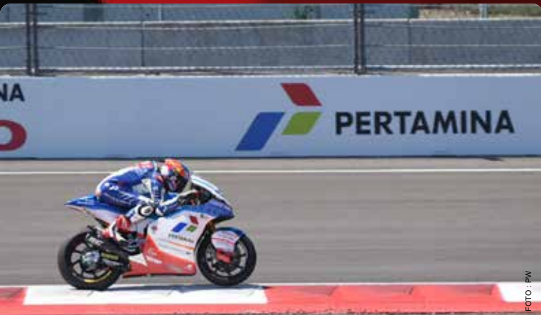
Pembalap Pertamina SAG Racing Team Bo Bendsnyder memacu motornya saat Qualifying 1 ajang Moto2 Pertamina Grand Prix Of Indonesia 2023 di Pertamina Mandalika International Circuit, Lombok Tengah, Nusa Tenggara Barat, Sabtu, 14 Oktober 2023.