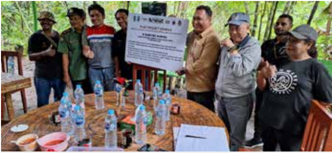
Kilang Pertamina Kasim dan beberapa stakeholder berkomitmen memberdayakan masyarakat di Kampung Warkesi, Kabupaten Raja Ampat, Papua Barat Daya.

RAJA AMPAT, PAPUA BARAT - Pilot Project KOMPAK (Kolaborasi Pemberdayaan Masyarakat Kampung Penyangga Kawasan Konservasi) di Kabupaten Raja Ampat, Papua Barat, resmi dimulai pada 12 hingga 14 September 2023. Kegiatan ini melibatkan PT Kilang Pertamina Internasional RU VII Kasim (Kilang Pertamina Kasim), Balai Besar Konservasi Sumber Daya Alam (BBKSDA) Papua Barat, Dinas Pariwisata Kabupaten Raja Ampat, Dinas Perikanan Kabupaten Raja Ampat, NGO Fauna & Flora Indonesia, Kelompok Tani Hutan (KTH) Warkesi, Kelompok Tani Hutan Waifo, Kelompok Tani Hutan Kalitoko, serta Staf Ahli Direktorat Jenderal Kementerian Lingkungan Hidup dan Kehutanan.