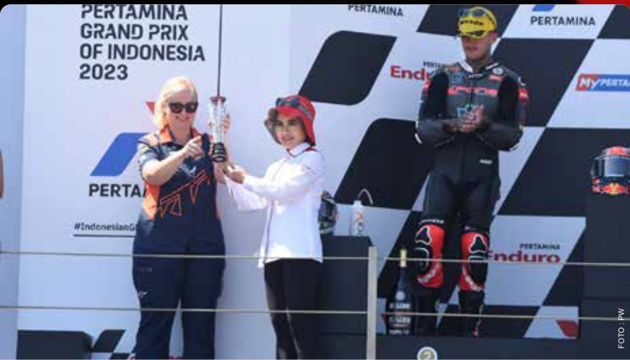
Direktur Utama menerima piala sebelum diserahkan kepada pemenang Moto2 di ajang Pertamina Grand Prix of Indonesia 2023, Minggu, 15 September 2023.

Penyelenggaraan Pertamina Grand Prix of Indonesia 2023 menjadi salah satu momentum besar tahun ini bagi masyarakat Indonesia. Selain meningkatkan global exposure bagi perusahaan dan bangsa, event balap internasional ini mampu memberikan multiplier effect bagi masyarakat sekitar. Berikut cuplikan rangkaian kegiatan Pertamina Grand Prix of Indonesia dalam gambar. •