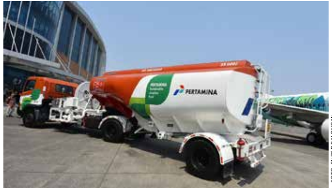
Proses pengisian Sustainable Aviation Fuel (SAF) ke Boeing 737-800 NG dengan nomor registrasi PK-GFX, milik maskapai Garuda Indonesia sebelum uji terbang.

"Dengan hasil tersebut, selanjutnya Garuda Indonesia siap untuk menajaki penggunaan SAF tersebut pada lini operasional penerbangan komersial. Tentunya kesiapan tersebut akan diselaraskan dengan kajian implementasi SAF secara komprehensif terhadap kesiapan sektor korporasi dalam mengadaptasi penggunaan energi terbarukan ini khususnya pada lini penerbangan komersial.