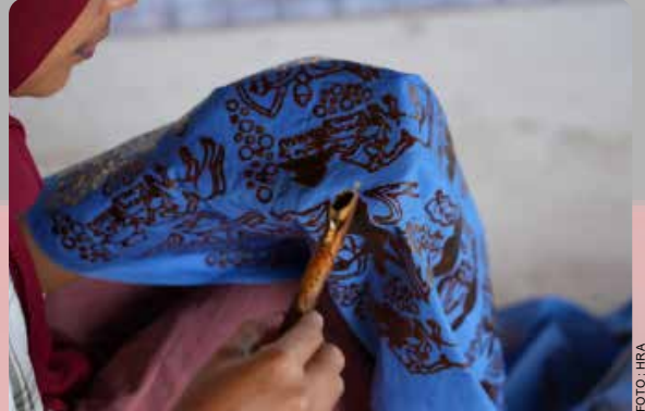
Batik Sasambo sebagai salah satu batik khas NTB dengan motif yang kental akan budaya adat Lombok, serta flora dan fauna, seperti rumah sasak, bambu, bunga dan bintang laut juga hadir di stan UMKM Pertamina di arena Pertamina Grand Prix of Indonesia 2023, Mandalika, NTB.

"Semoga keberadaannya menjadi peluang bagi pelaku usaha dan UMKM untuk melakukan penetrasi ke pasar global yang lebih luas," pungkasnya. PTM