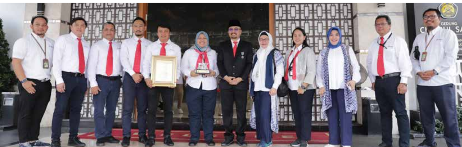
Tim PC Prove Omega foto bersama Menteri ESDM Arifin Tasrif usai menerima penghargaan Dharma Karya ESDM Madya 2023.