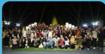
Jajaran Direksi Pertamina dan Pemimpin Redaksi Media Nasional berfoto bersama saat acara "Gathering Media 2023" yang diselenggarakan di Candi Prambanan, Yogyakarta pada Sabtu (16/12/2023)

“Dari acara Gathering Pemred, Pertamina memperoleh insight positif. Sehingga, diharapkan Pertamina dapat makin berkiprah untuk memajukan industri, berkontribusi pada masyarakat, serta aspek keberlanjutan untuk mendukung target Net Zero Emission (NZE) dan peningkatan perekonomian Indonesia,” pungkasnya. ●PTMDK