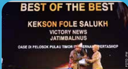
Direktur Utama Pertamina Nicke Widyawati menyerahkan penghargaan kepada pemenang best of the best saat acara Anugerah Jurnalistik Pertamina 2023 "Energizing The Nation" yang diselenggarakan di Ballroom Hotel Tentrem, Yogyakarta pada Jumat (15/12/2023)