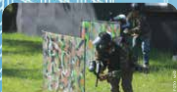
Para jurnalis Anugerah Jurnalistik Pertamina bermain pinball di area Balkondes Wringinputih yang bertempat di Yogyakarta, Jumat, (15/12/2023). Kegiatan ini merupakan rangkaian acara Anugerah Jurnalistik Pertamina 2023 "Energizing The Nation".