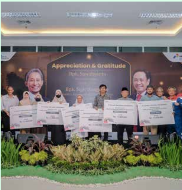
Manajemen PT KPB foto bersama dengan 6 LKS penerima santunan.