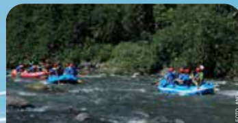
Para jurnalis Anugerah Jurnalistik Pertamina melaksanakan kegiatan rafting di Sungai Elo, Yogyakarta, Jumat, (15/12/2023). Kegiatan ini merupakan rangkaian acara Anugerah Jurnalistik Pertamina 2023 "Energizing The Nation".