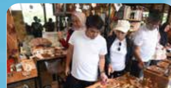
Pemimpin redaksi media nasional melihat kerajinan salah satu UMKM binaan Pertamina Joglo Ayu Tenan saat kegiatan "Pemred Gathering 2023" yang diselenggarakan di Workshop Joglo Ayu Tenan, Yogyakarta pada Sabtu (16/12/2023).