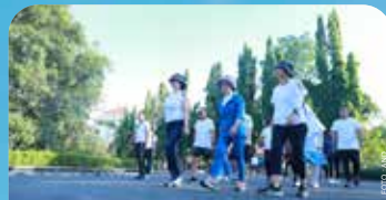
Direktur Utama PT Pertamina (Persero), Nicke Widyawati bersama jajaran manajemen dan pimpinan redaksi media melaksanakan fun walk di Area Lembah UGM, Yogyakarta, Sabtu, (16/12/2023).