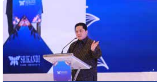
Menteri BUMN RI Erick Thohir memberikan sambutan pada acara Peringatan Hari Ibu dan Peluncuran Employee Well-Being Concern yang diselenggarakan di Ballroom Grha Pertamina, Jakarta, Rabu (13/12/2023).

"Harapannya dengan well-being ini tentunya bisa menambah kenyamanan, bisa generate leaders dan generate policy agar lebih ramah terhadap perempuan, ramah terhadap seluruh pekerja perempuan agar dapat bekerja di bidang apapun, baik di sektor migas maupun sektor lain," tutupnya. ●IDK/TA