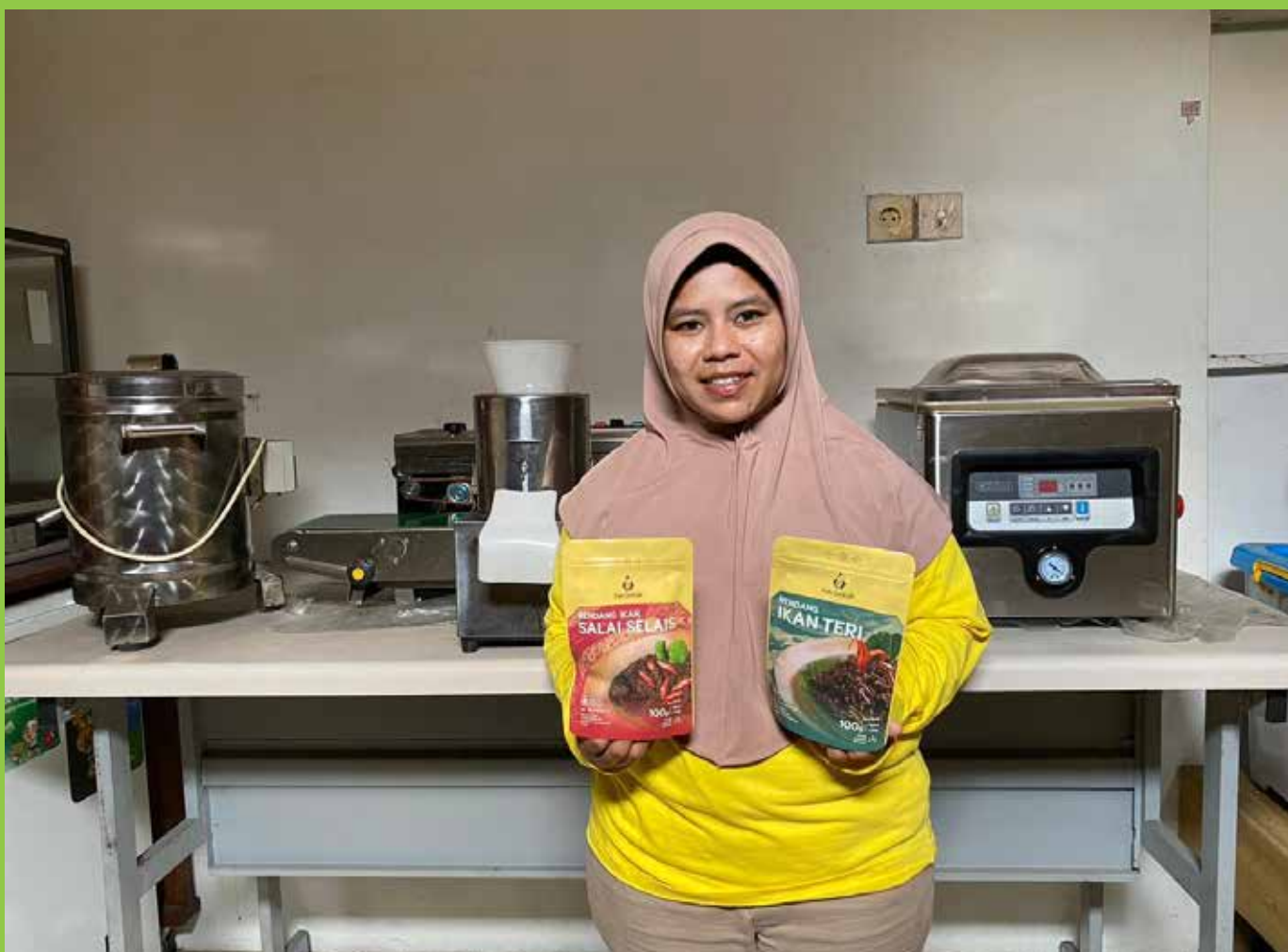
Salah satu penerima hibah teknologi tepat guna, Champion UMK Academy 2023. Pertamina akan membuka UMK Academy 2024 untuk jaring UMKM-UMKM berkualitas lainnya.