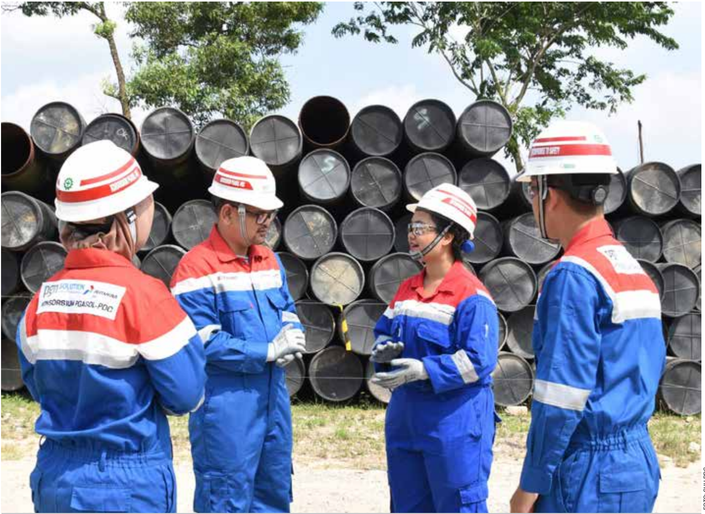
Manajemen PDC meninjau operasional di salah satu wilayah operasi.