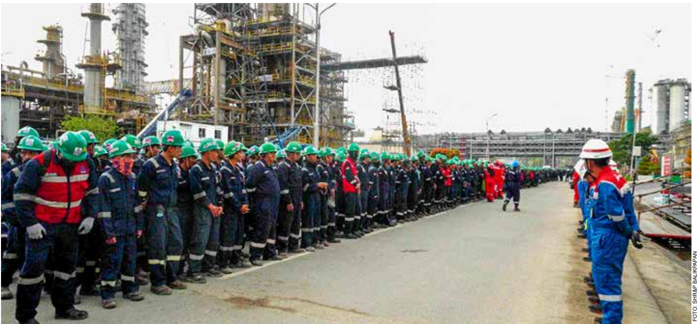
Tool Box Meeting di Kilang Balikpapan.

"Kita harapkan prosesnya lancar sehingga nanti bisa selesai sesuai target dan kilang Balikpapan akan menjadi kilang pengolahan terbesar yang dimiliki Indonesia dengan kapasitas 360 ribu barel per hari," ucap Fadjar. *SHR&P BALIKPAPAN