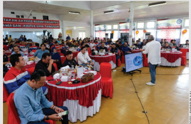
Anggota SPP RU III mengikuti acara kaderisasi untuk mewujudkan pekerja yang profesional dan aktivis yang berintegritas serta berwawasan, kritis dan tangguh di lingkungan perusahaan.

la juga berharap, para pekerja Kilang Pertamina Plaju yang