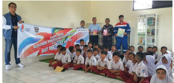
Revitalisasi perpustakaan dan penambahan buku bacaan untuk siswa Sekolah Dasar.

"Melalui Gaspedia Day , kami berharap para siswa