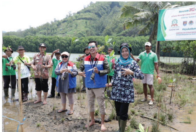
Penghijauan Pulau Momongan di Desa Jetis, Kecamatan Nusawungu.

Maka penanaman mangrove ini disebut sangat strategis untuk meningkatkan motivasi masyarakat dalam menjaga dan memanfaatkan mangrove secara bertanggung