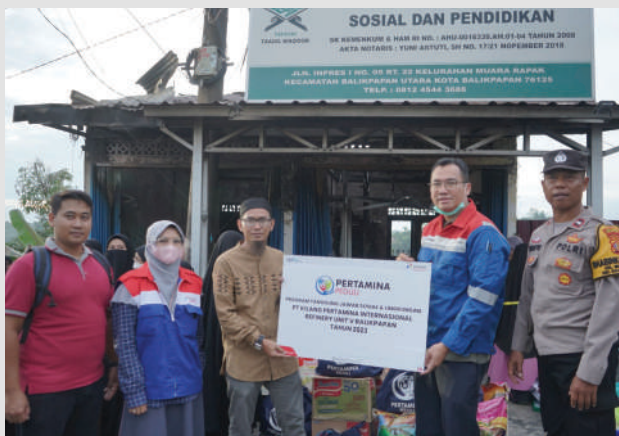
Pertamina melalui PT Kilang Pertamina Internasional (KPI) Unit Balikpapan menyalurkan bantuan berupa sembako dan peralatan mandi kepada Yayasan Taajul Waqoor di lokasi kebakaran.

PT KPI Unit Balikpapan kata Chandra sebagai salah satu tetangga terdekat tentunya juga memberikan bantuan sebagai bentuk kepedulian. "Bantuan ini kami harapkan tidak dilihat dari nilai dan jumlahnya, namun tentu