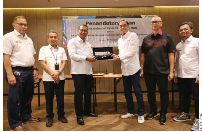
Penyerahan cenderamata usai penandatanganan MoU Program Konversi BBM ke Gas Bumi antara PT Gagas Energi Indonesia dengan PT Pertamina Drilling Services Indonesia.

Upaya optimasi pemanfaatan gas bumi sebagai energi transisi