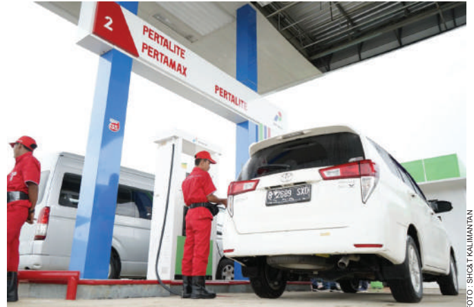
Makin tinggi konsumsi BBM oleh masyarakat, makin besar Pajak Bahan Bakar Kendaraan Bermotor (PBBKB) disetorkan Pertamina kepada pemerintah daerah

Di wilayah Kalimantan, PT Pertamina Patra Niaga menyetorkan total Rp5,91 triliun dari PBBKB yang diberikan ke pemerintah provinsi Kalimantan Barat, Kalimantan Timur, Kalimantan Tengah, Kalimantan Selatan, dan Kalimantan Utara. “Dari PBBKB tersebut, kami berharap pembangunan daerah akan semakin maju dan PT Pertamina Patra Niaga senantiasa akan terus berkontribusi terhadap