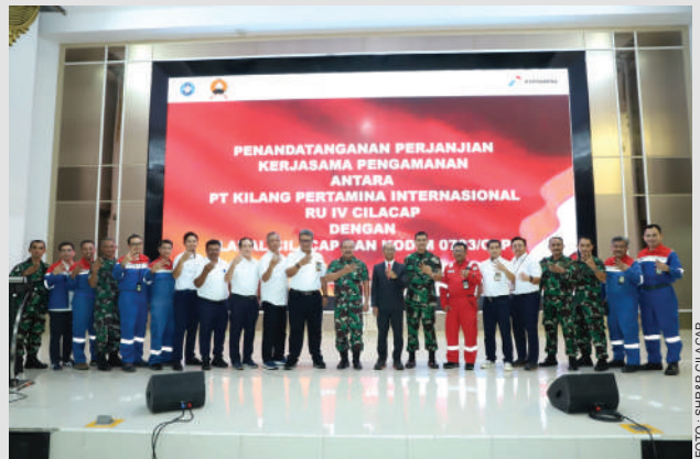
PT KPI Unit Cilacap bersinergi dengan TNI dalam mengamankan operasional Kilang Pertamina Cilacap sebagai objek vital nasional.

Kolonel Laut (PM) Sugeng Subagyo menyambut positif karena sampai saat ini Lanal menjadi salah satu elemen pengamanan obyek vital Nasional (obvitnas). “Hal ini