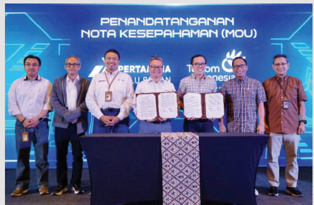
Penandatanganan nota kesepahaman/ Memorandum of Understanding (MoU) antara PHR dan metaNesia di Four Seasons Hotel Jakarta, Kamis (16/2) yang dihadiri oleh segenap manajemen dari kedua perusahaan BUMN.

"Eksistensi metaNesia sebagai platform dan ekosistem