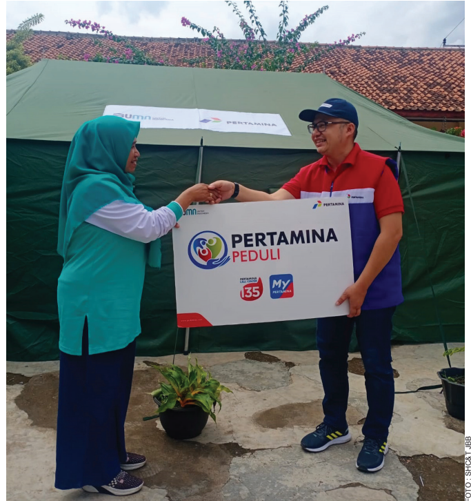
Penyerahan bantuan tenda secara simbolis untuk proses belajar mengajar di Sekolah Dasar Negeri (SDN) Taman Sari di Jalan Babakan Karet Nomor 69 Kampung Panembong Kaler Desa Mekarsari Kecamatan Cianjur.

Hingga saat ini Pertamina terus bersinergi dan berkolaborasi dengan stakeholder seperti BPBD, Dinas Sosial, Posko BUMN dan Polda Jabar untuk dapat menyalurkan donasi dan membantu pemulihan pasca gempa Kabupaten Cianjur. ●SHC&T JBB