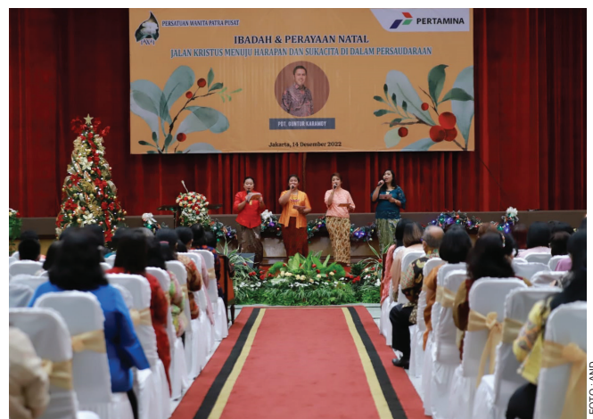
Ibadah dan Perayaan Natal PWP Tingkat Pusat dilaksanakan dengan khidmat.