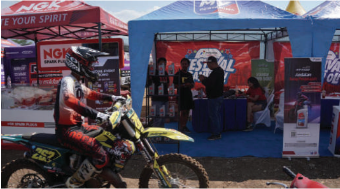
Salah satu pembalap melintasi stan MyPertamina di ajang Kejuaraan Nasional (Kejurnas) Kepala Staf Angkatan Laut (KASAL) Cup Supertrack Putaran Salatiga 2023.