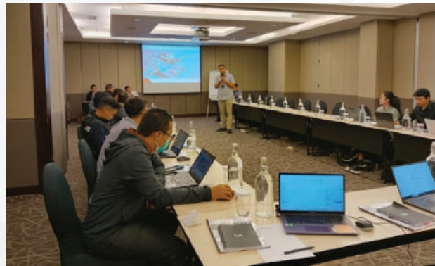
Paparan Manager PMO Gas, Power, & NRE – CPM Dit. Logistik & Infrastruktur bersama Perwira Proyek PDC

yang komprehensif mulai dari praktik manajemen hingga internal audit manajemen proyek berstandar ISO 21502.