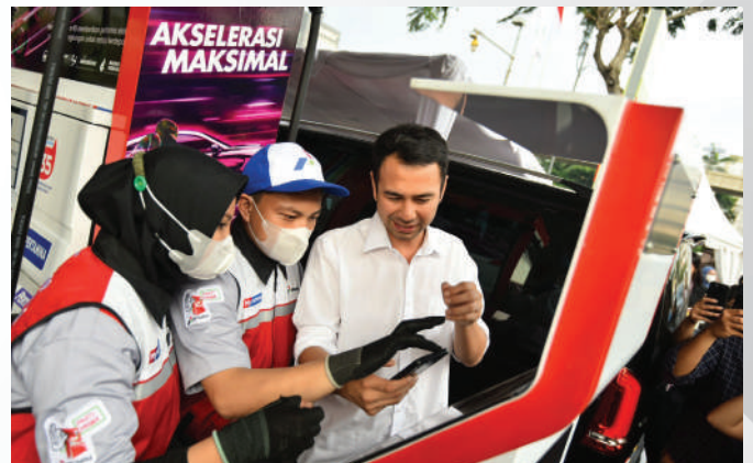
Salah satu selebriti Indonesia, Raffi Ahmad melakukan pembayaran dengan menggunakan aplikasi MyPertamina setelah melakukan pengisian BBM jenis Pertamina Green 95 di SPBU MT Haryono, Jakarta.