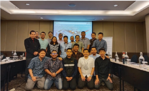
Kick Off Meeting Implementasi ISO 21502 Project Management System

Dalam menjalankan peran memfasilitasi dan memberikan value kepada project stakeholder Pertamina termasuk Anak Perusahaan di bidang kontraktor, Fungsi Central Project Management Dit. Logistik & Infrastruktur telah melaksanakan Kick Off Meeting Implementasi ISO 21502 Project Management System bersama PT Patra Drilling Contractor (PDC) pada Selasa, 25 Juli 2023 yang lalu.