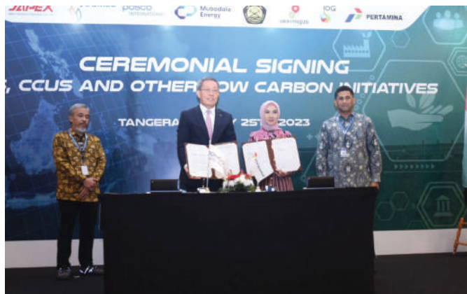
Direktur Utama Pertamina Nicke Widyawati dan Direktur Utama POSCO International bersama usai menandatangani MOU Pengembangan Carbon Capture, Utilization, Storage (CCS/CCUS) dan Low Carbon Products di Indonesia, Selasa, 25 Juli 2023, di ICE BSD.

Dengan kapasitas penyimpanan CO 2 yang sangat besar ini, proyek dekarbonisasi di Indonesia juga akan memberikan kontribusi yang signifikan