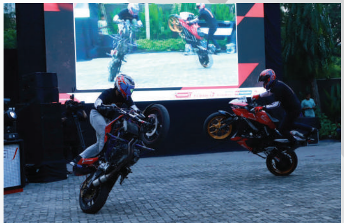
Launching Pertamina GP of Indonesia turut dimeriahkan dengan aksi freestyle motor yang diselenggarakan di The Space, Senayan City, Jakarta, Sabtu (22/7/2023).