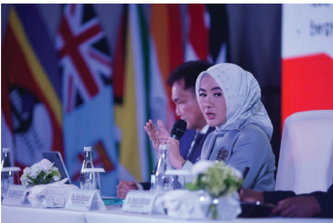
Direktur Utama Pertamina Nicke Widyawati menjadi salah satu pembicara di acara 5th Meeting of All Members of The Working Group on Audit of Extractive Industries (WGEI) dengan tema The Global Energy Transition yang diadakan oleh Badan Pemeriksa Keuangan (BPK), pada Senin (24/7/2023).

Pemerintah juga memiliki peran penting dalam mendukung langkah-langkah Pertamina. "Kebijakan yang mendukung dan memfasilitasi transformasi energi sangatlah vital. Dengan dukungan penuh dari Pemerintah, kami yakin dapat mewujudkan visi bersama untuk masa depan energi yang lebih baik," tutup Nicke. ●HS