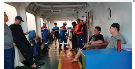
Kru dan penumpang kapal nelayan yang berhasil diselamatkan beristirahat sambil menunggu penjemputan oleh pemilik kapal.