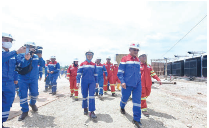
Menteri ESDM Arifin Tasrif didampingi Direktur Utama Pertamina Nicke Widyawati meninjau langsung Sumur Gulamo di PHR Duri, Kamis (27/7/2023).

"Di WK Rokan potensi MNK ini ada di wilayah sumur Gulamo, dengan rencana total kedalaman mencapai 8.559 kaki. Sumur ini merupakan salah satu dari dua sumur eksplorasi vertikal yang direncanakan oleh PT Pertamina Hulu Rokan sebagai