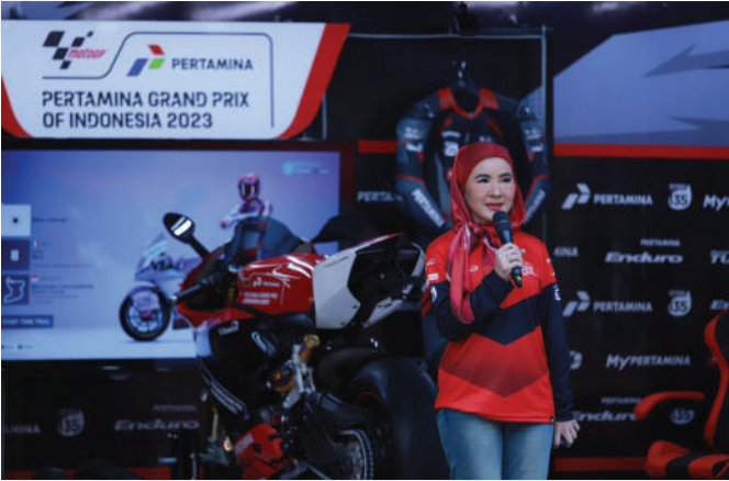
Direktur Utama Pertamina, Nicke Widyawati memberikan sambutan ketika meluncurkan Pertamina Grand Prix of Indonesia, di area Senayan City, Jakarta, Sabtu (22/7/2023).