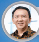
Basuki Tjahaja Purnama Komisaris Utama