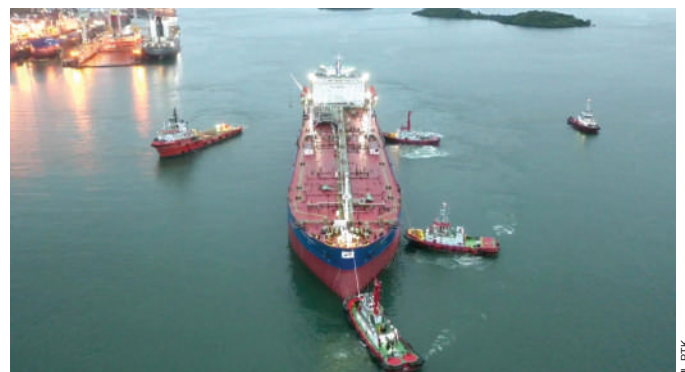
PTK ikut berperan aktif dalam proses towing kapal FSO Pertamina Abherka dari perairan Batam menuju lapangan Poleng, di lepas pantai Jawa Timur.

Saat Kapal FSO Pertamina Abherka milik PIS tiba di Poleng Field, PTK juga membantu proses swapping FSO Abherka dengan MT Gamkonora selaku Temporary Storage Terminal . ●SHIML-PTK