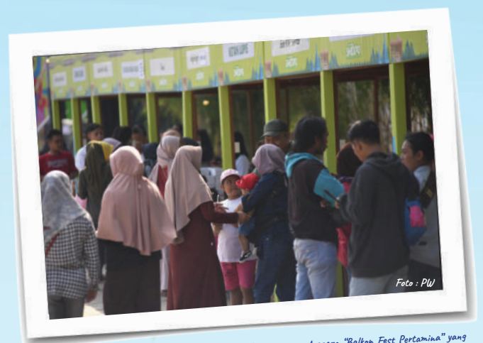
Masyarakat mengunjungi booth Balkon Food UMKM Pertamina saat acara "Balkon Fest Pertamina" yang diselenggarakan di Balkondes Wringin Putih, Borobudur, Magelang, Jawa Tengah, Minggu (23/7/2023).