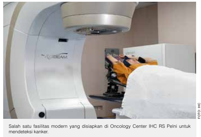
Salah satu fasilitas modern yang disiapkan di Oncology Center IHC RS PelnI untuk mendeteksi kanker.

Oncology Center RS PELNI telah melayani lebih dari 2.100 pasien kanker sepanjang 2022 dengan kasus terbanyak, yaitu kanker Payudara, kanker paru, kanker otak, kanker tiroid, dan kanker ovarium. Sepanjang 2022, RS PELNI telah melayani lebih dari 350 siklus kemoterapi. ■ IHC