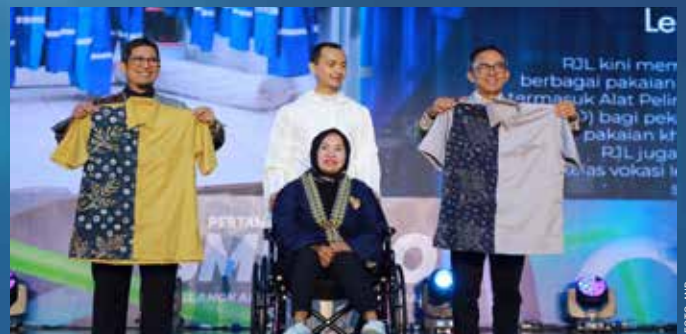
Produk UMKM berkualitas binaan Pertamina hadir pada Pertamina SMEXPO 2023. Sejalan dengan nilai inklusivitas yang saat ini dijunjung oleh Pertamina, tahun ini Pertamina fokus pada program Sobat Istimewa untuk komunitas difabel dan berkebutuhan khusus.