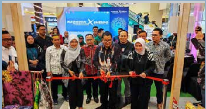
Peresmian Temu Bisnis Penguatan Rantai Pasok Industri Parekraf bertajuk "KENAROK INPAREKRAF X PERTAMINA SMEXPO" (Kemitraan Nasional Rantai Pasok Industri Pariwisata dan Ekonomi Kreatif) di Balikpapan, Kalimantan Timur.

"Kami berharap ajang ini dapat menjadi One Stop Solution bagi UMKM dan Konsumen baik konsumen ritel maupun bisnis. Pada jangka panjang