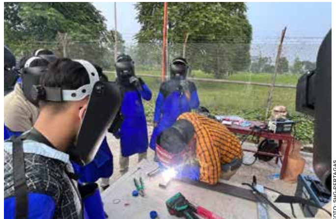
Peserta pelatihan welder memperhatikan cara instruktur melakukan pengelasan.

Dilihat dari potensi alam yang ada, wilayah Pulau Untung Jawa memiliki sumber daya yang melimpah dengan kawasan pantai, laut, mangrove hingga area konservasi yang menjadi daya tarik wisatawan. Ke depan, potensi ini diharapkan bisa dikembangkan bersama lebih baik lagi sehingga memberikan kontribusi untuk kemajuan masyarakat. ●SHG-NR