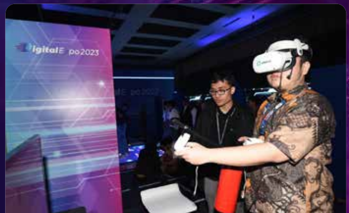
Pengunjung mencoba virtual games saat acara "Pertamina Digital Expo 2023" yang diselenggarakan di Hall Kasablanka, Jakarta pada Rabu (11/11/2023)