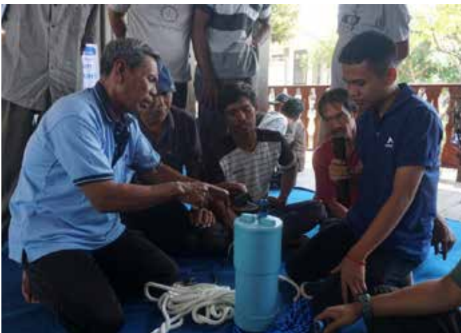
Edukasi tentang Rumpon Portable Electronic FAD (eFAD) kepada nelayan di Pulau Untung Jawa.

Program CSR Pertagas sejalan dengan Tujuan Pembangunan Berkelanjutan (TPB) atau Sustainable Development Goals (SDGs) Dengan menopang pilar ke-8 yakni Pekerjaan Layak dan Pertumbuhan Ekonomi. ●SHG-PERTAGAS