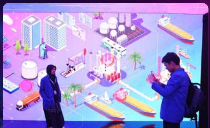
Seorang mahasiswa mengabadikan momen kehadirannya di "Pertamina Digital Expo 2023" yang diselenggarakan di Hall Kasablanka, Jakarta pada Rabu (11/11/2023)