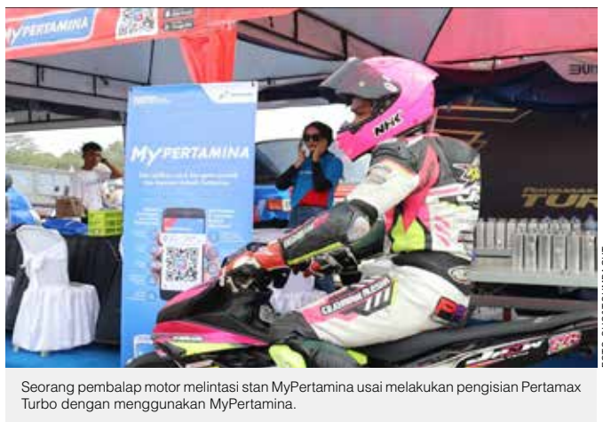
Seorang pembalap motor melintasi stan MyPertamina usai melakukan pengisian Pertamax Turbo dengan menggunakan MyPertamina.

"Kami ingin menciptakan kebiasaan baru, yakni penggunaan BBM kualitas tinggi yakni Pertamax Turbo dan Pertamina Dex, serta pembayaran non tunai dengan aplikasi MyPertamina. Reward bulanan sudah kami siapkan bagi anggota IMI Sumatera Barat yang paling banyak mengumpulkan poin di program ini," tutup Narotama. ●SHC&T SUMBAGUT