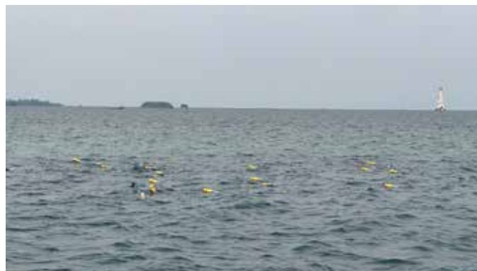
Kapsurula (Kapsul Pelampung Rumput Laut Ramah Lingkungan) yang diinisiasi oleh Badak LNG sebagai navigasi jalur kawasan rumput laut dan transportasi laut dalam menunjang budi daya rumput laut di perairan sekitar Kampung Tihi-tihi, Kelurahan Bontang Lestari.

Adapun keunggulan dari terobosan baru ini ialah pada ketahanan alat. Ketahanan Kapsurula ditaksir mencapai 15 tahun. Hal ini tentu dapat menekan penggunaan sampah plastik. Kapsurula juga menjadi navigasi jalur kawasan rumput laut dan transportasi laut dengan dilakukannya pengecatan agar nampak dipermukaan lautan. ●SHU-BADAK LNG