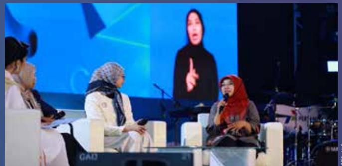
Dalam acara Pertamina SMEXPO 2023 juga diadakan Talkshow "Satukan Sinergi untuk UMKM Indonesia" yang diselenggarakan di Ballroom Grha Pertamina, Jakarta, Selasa, (31/10/2023).