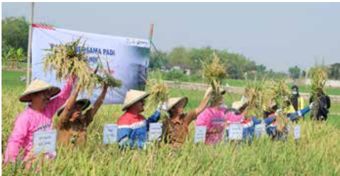
Panen perdana pertanian organik di Desa Rahayu, Kecamatan Soko, Kabupaten Tuban, Jawa Timur.

TUBAN, JAWA TIMUR - Petani di Desa Rahayu, Kecamatan Soko, Kabupaten Tuban, binaan Pertamina EP Sukowati Field dari Regional Indonesia Timur Subholding Upstream Pertamina untuk pertama kalinya merasakan panen perdana pertanian organik. Melalui program tersebut, mereka mendapatkan hasil berlipat dibandingkan dengan pertanian konvensional, sekaligus melakukan program peningkatan kualitas lingkungan yang berpengaruh pada kesuburan tanah.