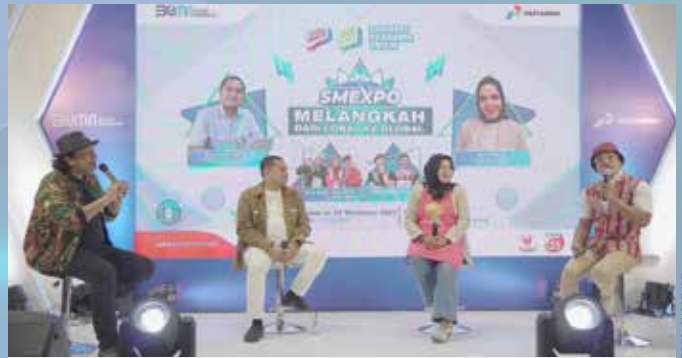
Salah satu talkshow yang diadakan di acara Pertamina SMEXPO Semarang.

Dalam SMEXPO Semarang, Pertamina juga memberikan apresiasi kepada para pelanggan setia, khususnya bagi para pengguna aplikasi MyPertamina dengan membagikan voucher belanja SMEXPO Semarang.