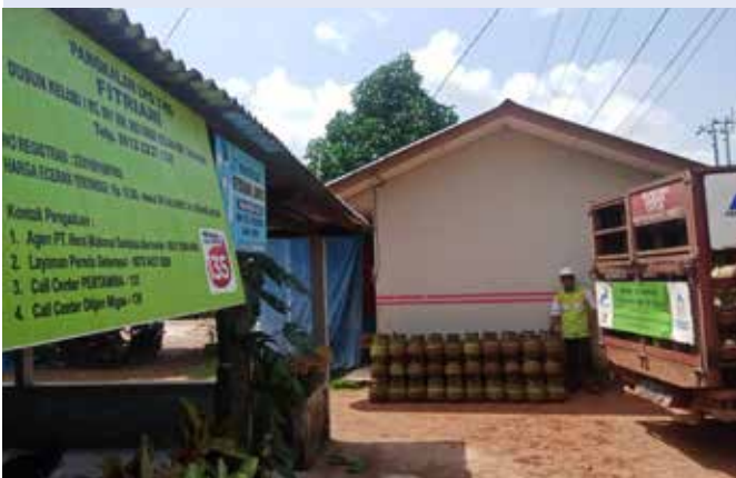
Salah satu pangkalan LPG 3 kg di Kepulauan Bangka Belitung.

Bagi masyarakat mampu, Pertamina menyediakan alternatif LPG Non Subsidi dalam produk Bright Gas yang terdiri dari Bright Gas Can berukuran 220 gram, Bright Gas 5,5 kg dan 12 kg yang bisa didapatkan di agen atau pangkalan LPG Pertamina, SPBU, serta toko modern. ●SHC&T SUMBAGSEL